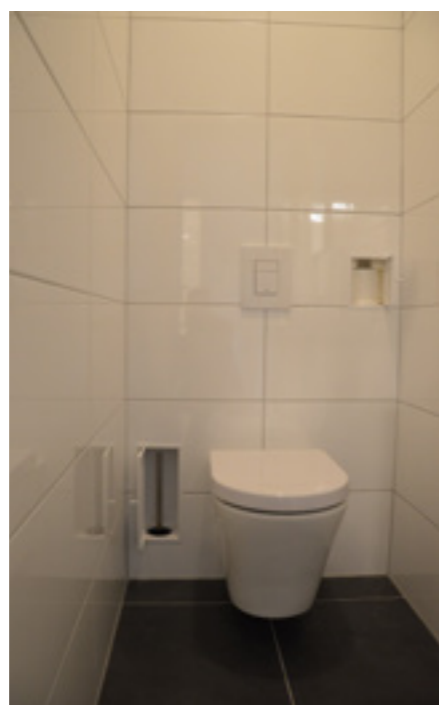
RVS geborsteld Artikelnr. 3059239