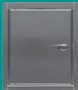
RVS gepolijst (Chroom) Artikelnr. 3059215