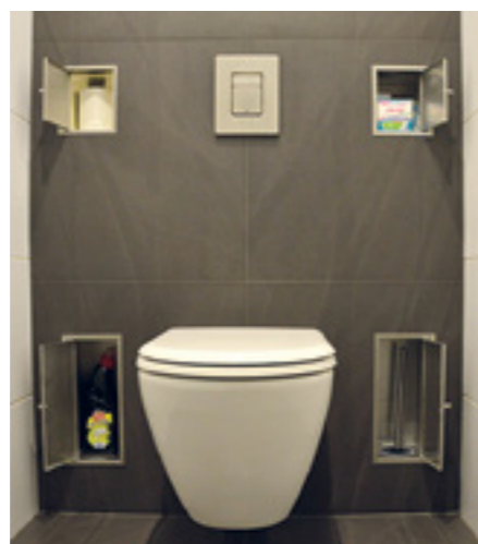
RVS geborsteld Artikelnr. 3059260