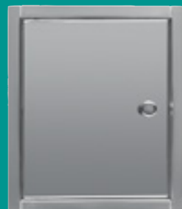
RVS geborsteld Artikelnr. 3059208

De Roll-up is geschikt voor wanddiktes variabel van 2,5 cm tot en met 5 cm.