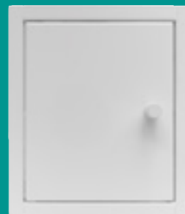
Wit gepoedercoat (RAL 9003) Artikelnr. 3059222